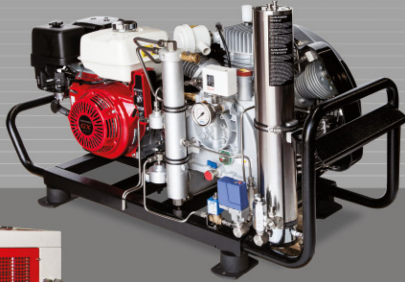
Mariner (Petrol Engine)