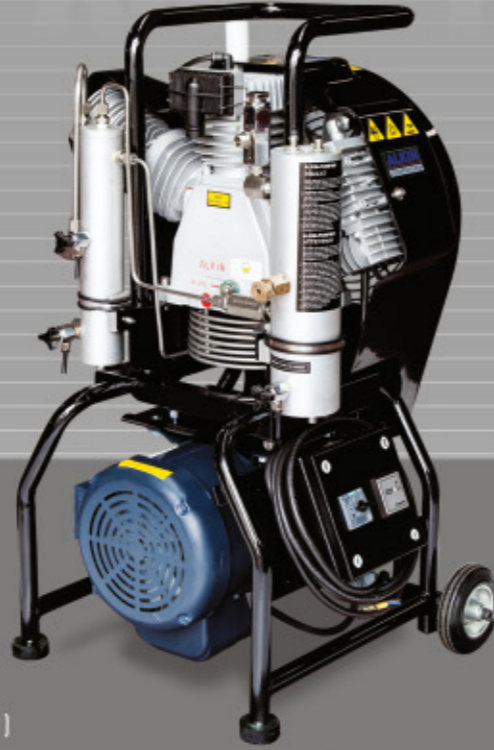
Mariner (Electric Engine)